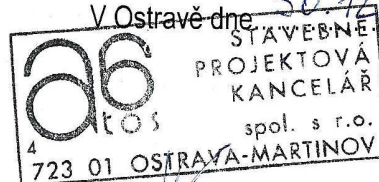
za zhotovitele Ing. arch. Radim Václavík jednatel